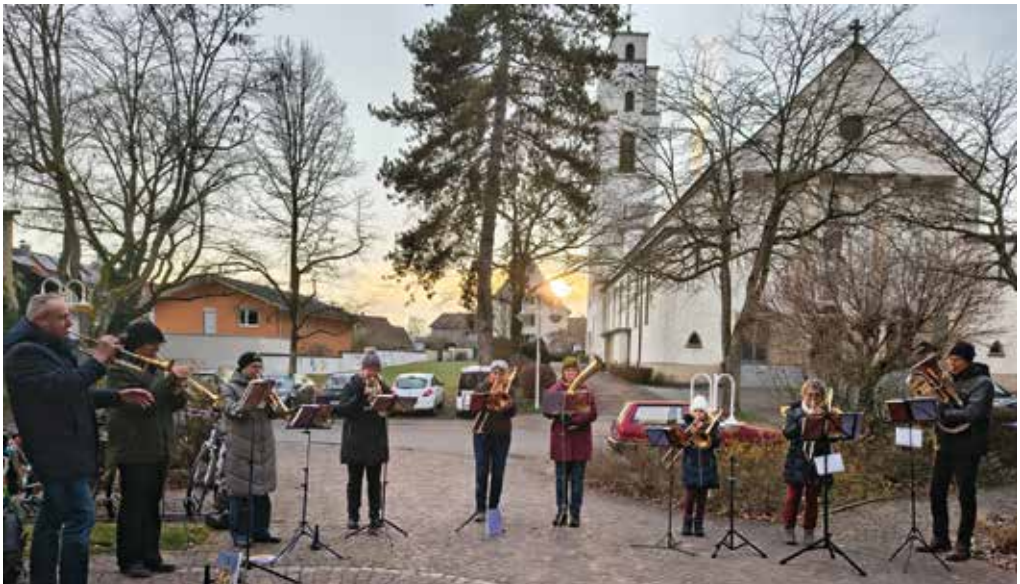
Am 1. Advent 2025 beim „Advent-Lieder-Spielen“ vor dem Pflegeheim St. Hildegard in Gottmadingen.

Auch meine Chorfreundinnen und Chorfreunde beschreiben ganz ähnliche Bedeutungen, die die Musik und unsere Gemeinschaft für sie haben. In Gemein-